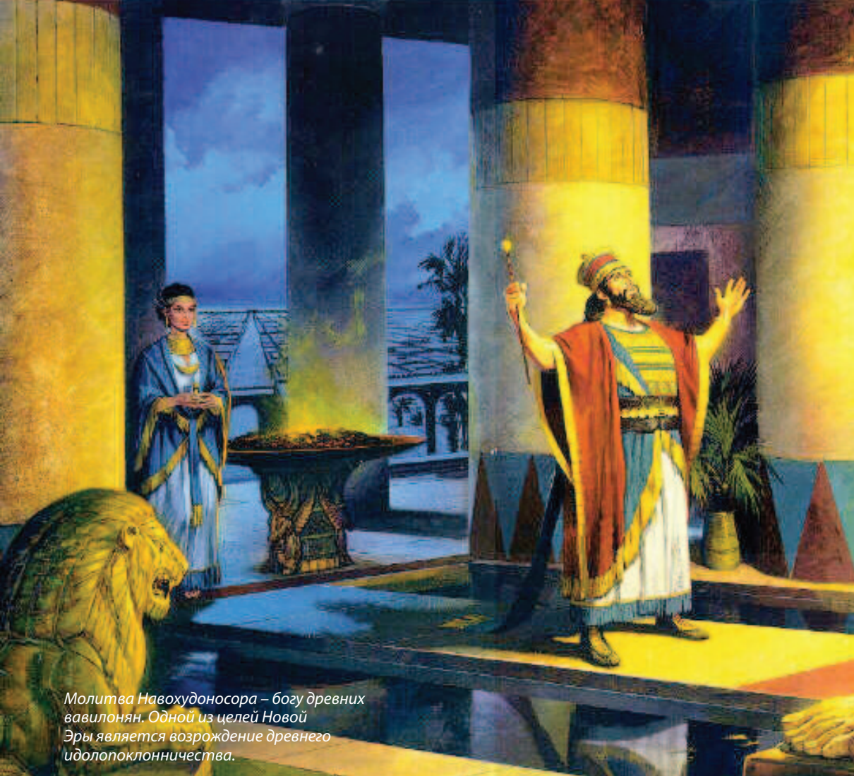
Молитва Навоходоносора – богу древних вавилонян. Одной из целей Новой Эры является возрождение древнего идолопоклонничества.

ностью. Имя её - Семирамида. Жители древнего Вавилона, отвергнув Создателя, поверили во лживое учение гуманизма, то есть свержение Бога с престола и обожествление человека. Они занимались астрологией и поклонялись солнцу, луне и звёздам. Но, главным образом, поклонялись Земле и своей богине-матери, считая, что она была живым дышащим существом. Её сатаническим числом в древнем Вавилоне был 666. В древнем Вавилоне также поклонялись солнечному богу Деннице. На городе лежала печать поклонения Сатане, чувственности, искусству чёрной магии и апокрифам.