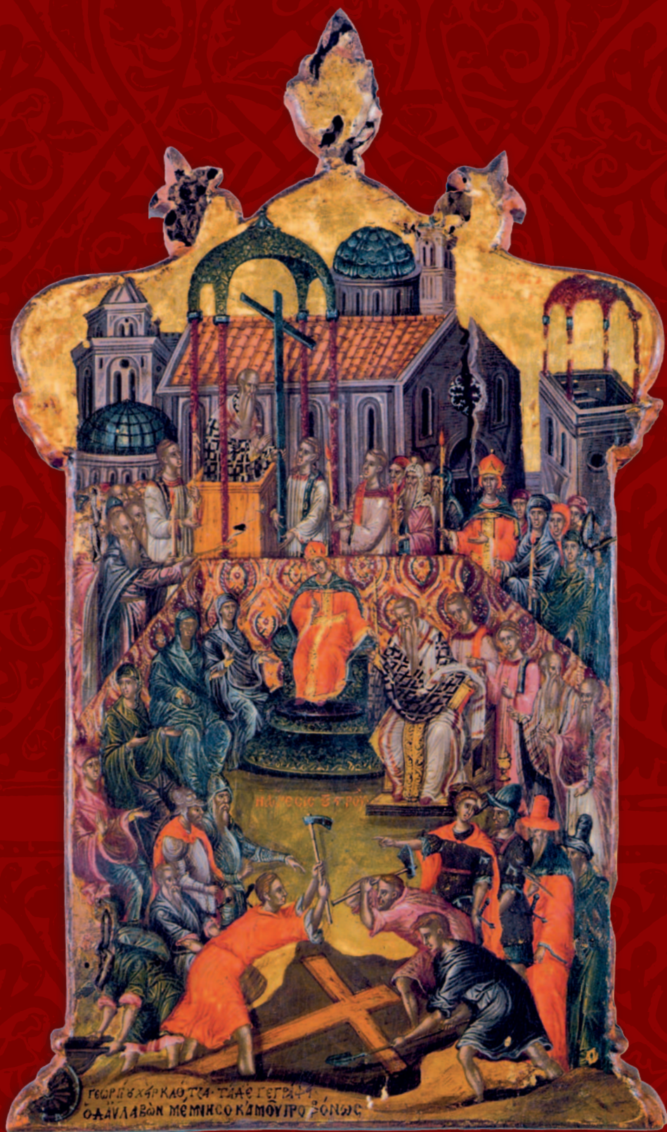
Обретение Святого Креста Господня Внешняя сторона триптиха Георгия Клондза, около 1596 г.