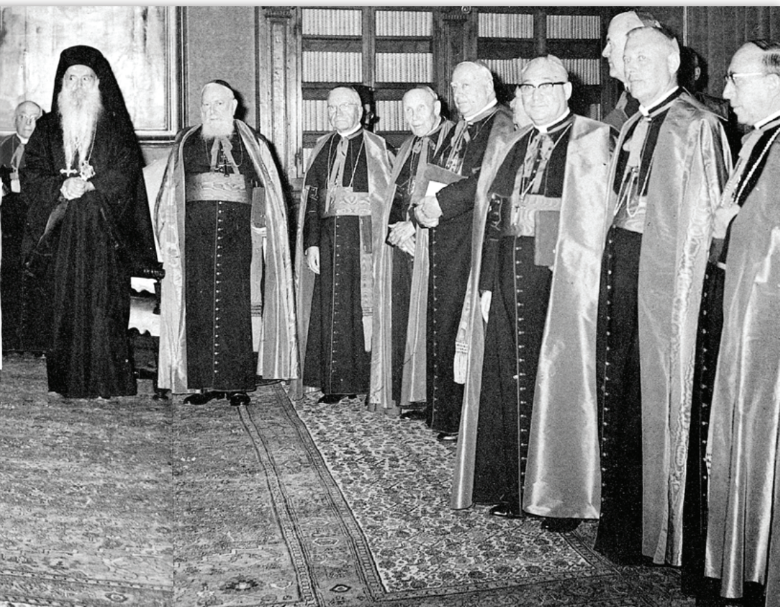
...ой библиотеке Папы в Ватикане во время обмена дарами. Предательство лишь начинается ...