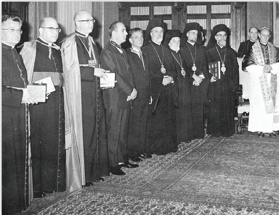
Папа Римский Павел VI и Патриарх Афинагор вместе с сопровождающими их лицами в частной