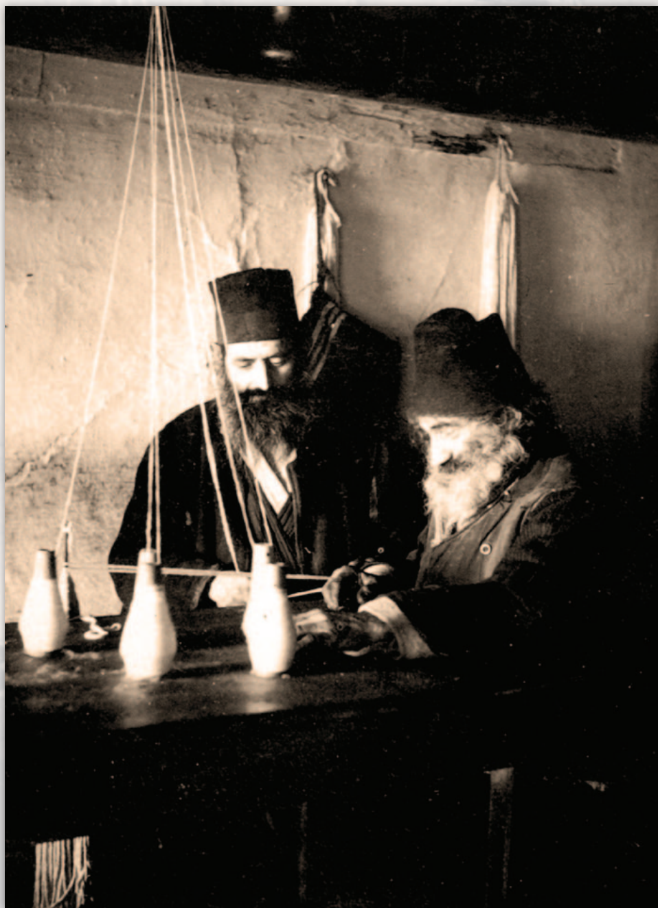
Изготовление свечей в Кавсокаливья.

Фотография, снятая Константином Вамвакасом (около 1940 г.)