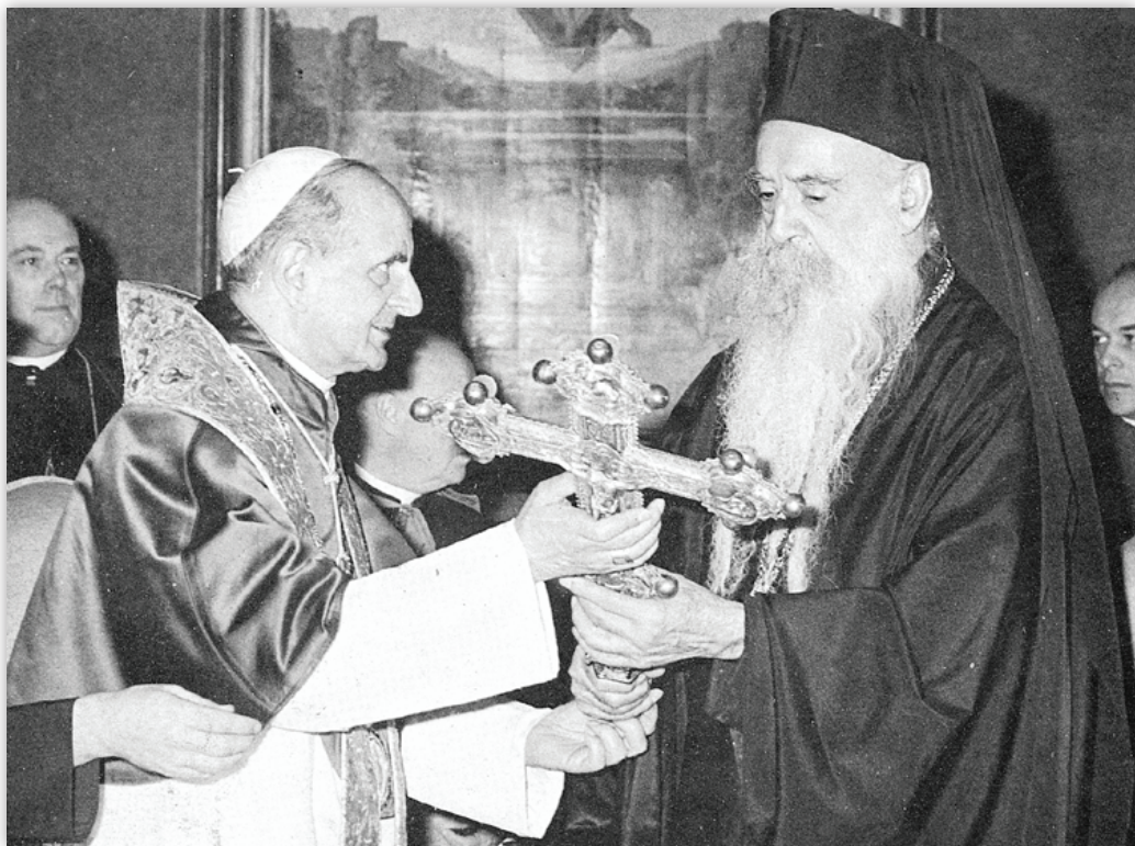
Папа тоже преподносит свой дар своему единомышленнику Патриарху. Это крест для литании, изготовленный в 16 веке. Только Богу известно, был ли данный крест одним из дорогих трофеев Ватикана, полученных в результате ограбления православных церквей в прошлом.

тить невидимую церковь в видимую! Это они планируют осуществить во всём мире, среди хороших, по их мнению, людей, объединяя их в единой организации, вне существующих ересей и вне Божией Православной Церкви. Те, кто когда-то делали особый упор на веру и пренебрегали внешними деяниями, сегодня, для достижения своего внешнего союза, подчёркивают внешние деяния и пренебрегают верой. Протестанты стремятся к единству, но не к христианскому единству веры, а к недогматическому мирскому единству.